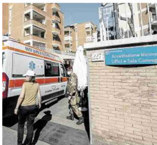
Uno degli ingressi del San Raffaele, dove la Regione ha contato in tutto 109 positività